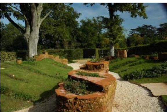
un deux tros..quatre

di ventaglio propone un'associazione di colori e suoni in un giardino tutto attraversato da una passerella in legno e interrotto da tende in tessuto che frusciano al vento; in "Chant de bambous (Fr)" all'interno di un boschetto di bambù vivi si scopre l'effetto sonoro di un gruppo di bambù sospesi a una struttura di ferro. Interessanti alcuni materiali innovativi che sono stati proposti in un paio di giardini: k-Matisse, un tessuto in polipropilene prodotto da Novinitiss, è utilizzato –colorato di verde- come struttura per rampicanti ("A l'abri des plantes grimpanes, Francia) e un nuovo tipo di cemento traslucido che offre un bell'effetto di trasparenza è stato inventato da due progettisti statunitensi e usato per una capanna al centro di un giardino d'impronta minimalista ("L'ombre du béton translucide"). Infine occorre segnalare la sezione dedicata alle nuove composizioni di essenze erbacee e graminacee che il Conservatoire du Chaumont ha allestito nelle aiuole tematiche (giardino di ghiaia, giardino arido, giardino di lava nera...) che costeggiano il percorso dei giardini del concorso.